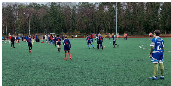
10 | Zawody w ramach Współzawodnictwa Sportowego Szkół – Igrzyska Dzieci (roczniki 2012 i młodsze).

15.03 Sobota, 11.00 Piłka nożna dziewcząt i chłopców Boisko syntetyczne, ul. Matejki 17A organizator: OSiR Wyspiarz wstęp wolny