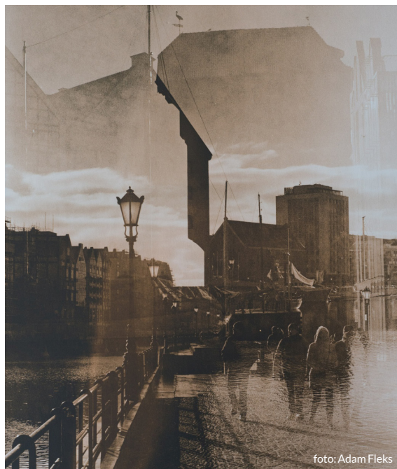
Udział w warsztatach po zakupie ulgowego biletu wstępu do Muzeum, w wysokości 16 zł.

15.03 Sobota, 12.00-18.00 Adam Fleks – warsztaty litowe w mokrej ciemni fotograficznej. Wystawa pt. „Wielościaty” Muzeum Rybołówstwa Morskiego, pl. Rybaka 1 organizator: Muzeum Rybołówstwa Morskiego