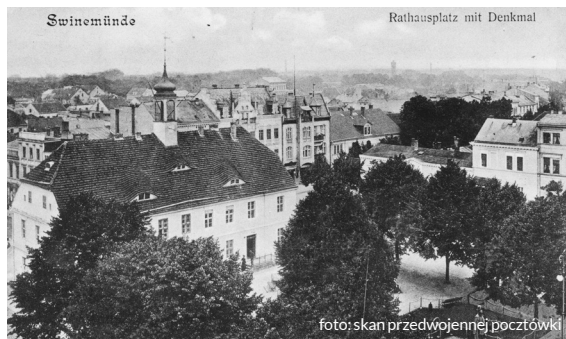
foto: skan przedwojennej pocztówki